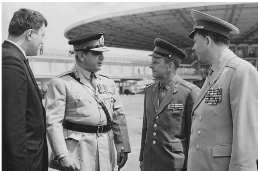
Фото 6. Встреча генерала А.Г. Яхья-хана (второй слева) в Шереметьево. 1968 г.