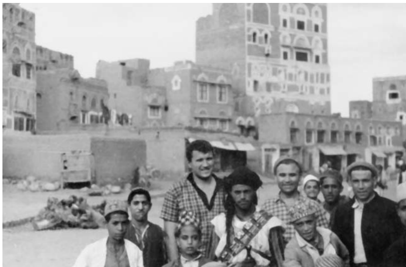
Фото 3. Иемен, г. Сана, 1963 г.