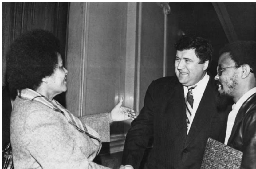
Фото 10. С Рут Момпати, будущим членом парламента ЮАР, послом и мэром. Москва, 1978 г.