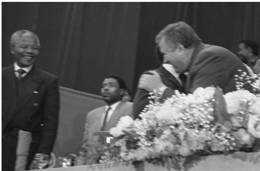
Фото 17. После выступления на конференции АНК. Автора обнимает Уолтер Сисулу, слева – Нельсон Мандела. 1991 г.