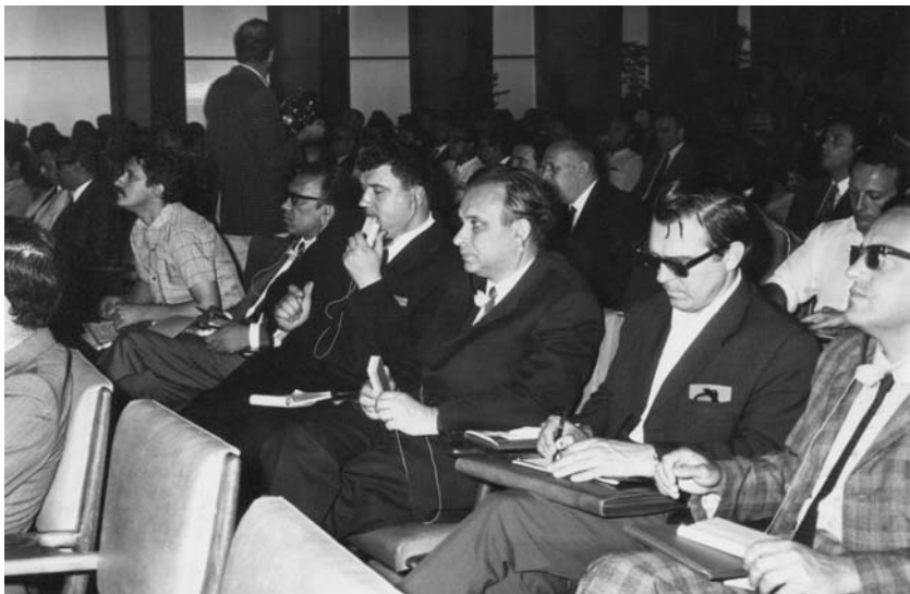
Фото 7. На Римской конференции. 1970 г.