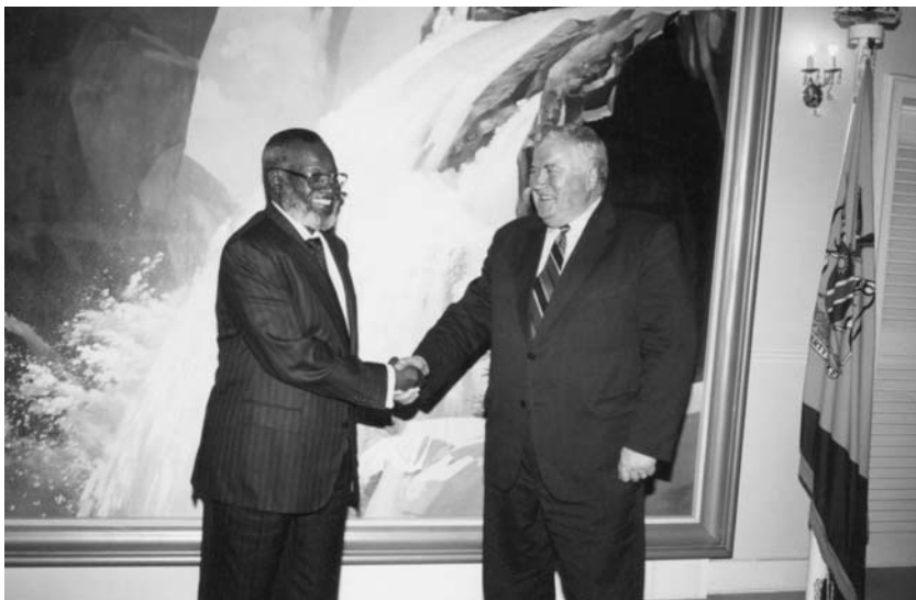
Фото 19. С президентом – основателем Республики Намибия С. Нуйомой. Виндхук, 2010 г.