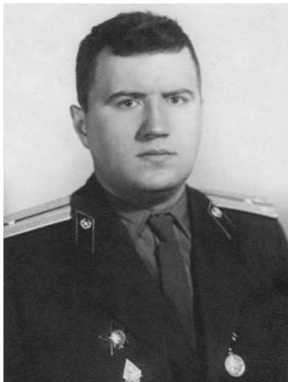
Фото 4. После второй командировки в Африку. 1965 г.