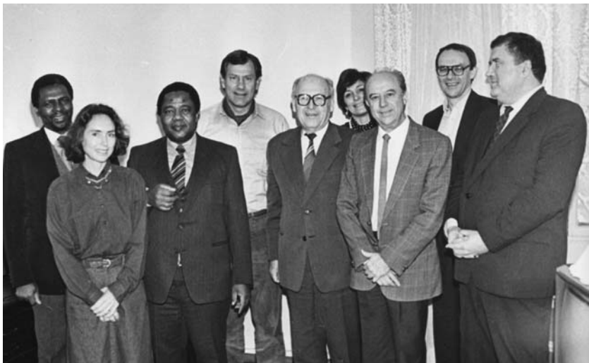
Фото 16. Делегация Института демократической альтернативы для Южной Африки (ИДАСА) в СКССАА. В центре – С. Макана, представитель АНК в СССР, будущий посол ЮАР в РФ, Ф. Ван Зейл Слабберт и В.Г. Солодовников. 1989 г.