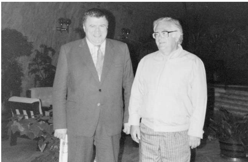
Фото 15. С Джо Слово (справа). Замбия, г. Лусака, 1986 г.