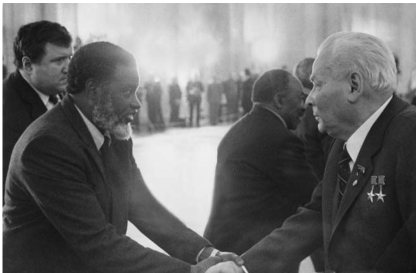
Фото 13. Церемония после похорон Ю.В. Андропова. Автор, С. Нуйома, А. Нзо, К.У. Черненко. Москва, 1984 г.