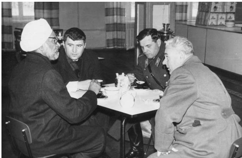
Фото 5. Министр обороны Индии Сваран Сингх в Таманской дивизии. 1968 г.