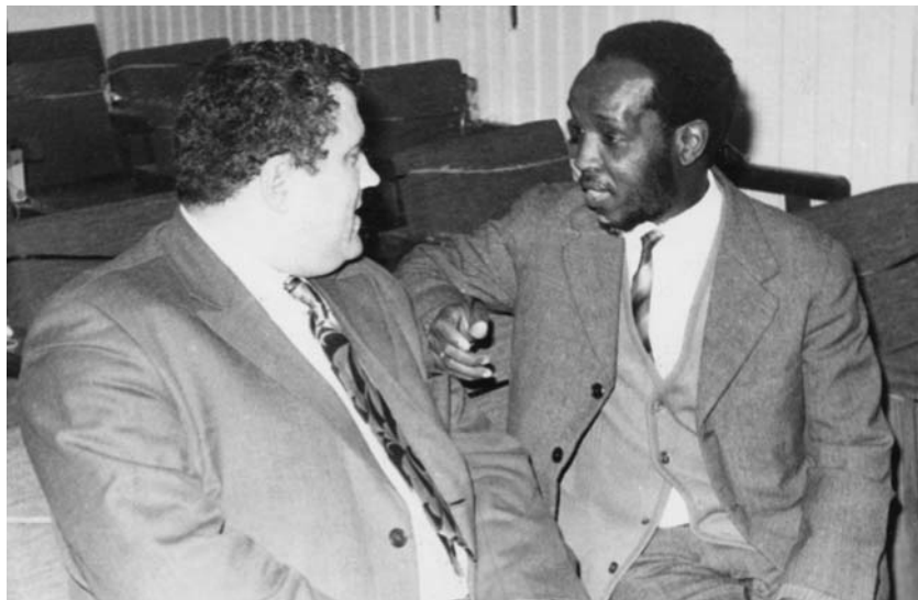
Фото 8. С Джо Нхланхлой, будущим министром разведывательных служб ЮАР, на конференции в Багдаде. 1974 г.