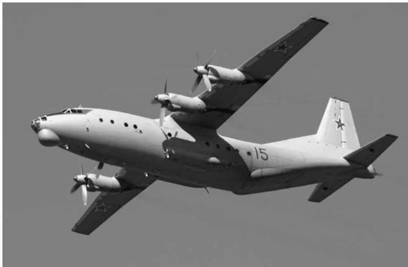
Фото 2. Ан-12 – рабочая лошадка войны.