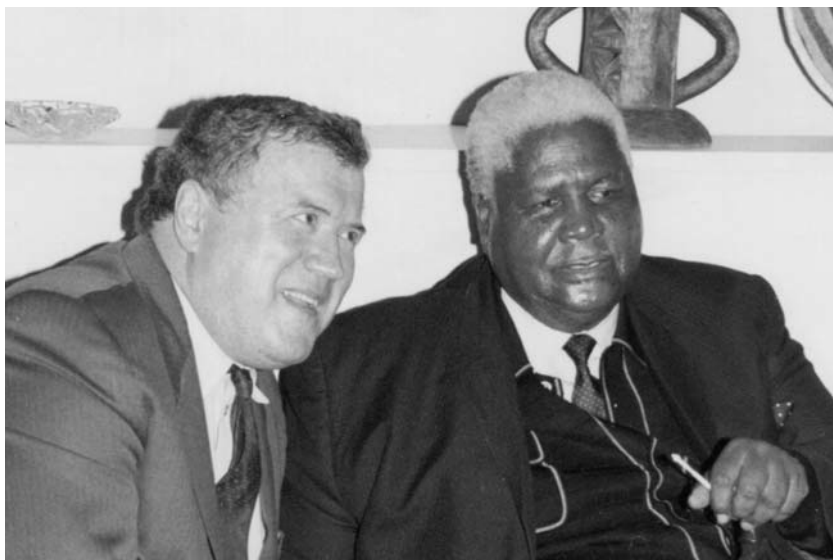
Фото 18. Снова с Дж. Нкомо. Москва, 1991 г.