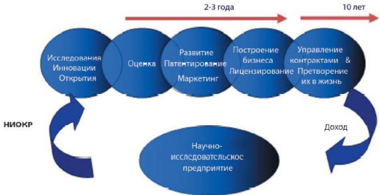
Рисунок 2. Процесс трансфера технологий