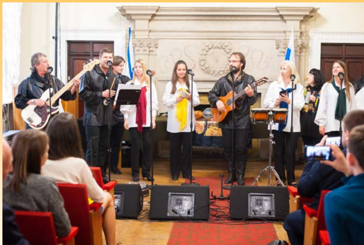
Народный ансамбль России "Гренада".