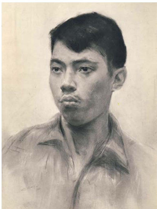
С. Скубко. Портрет студента из Индонезии. 1961

выполнять по фотографиям, приглашая, чтобы «вдохнуть в них жизнь», натурщиков. Вспоминаю, как в дни юности я долго позировал отцу в толстовке «под Горького» для картины «Ленин и Горький в Горках».