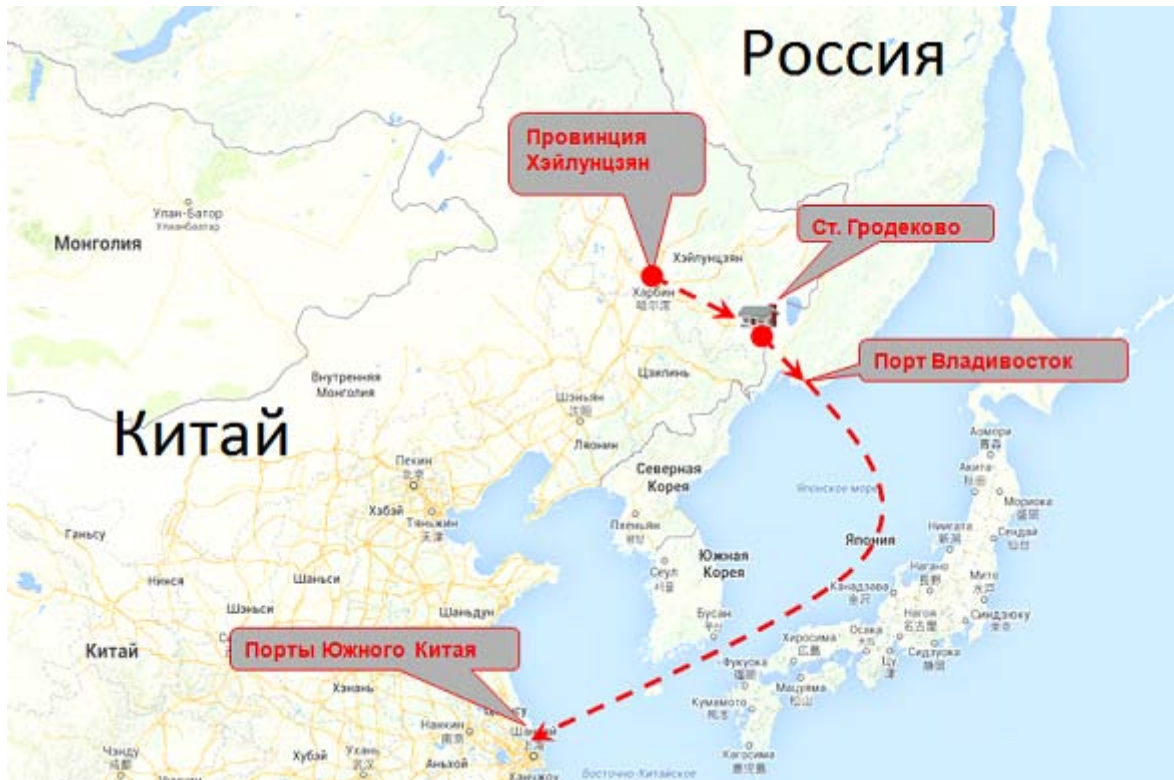
Рис. 1. МТК «Приморье-1» (Харбин — Гродеково — Владивосток/Находка/Восточный — порты АТР) 1